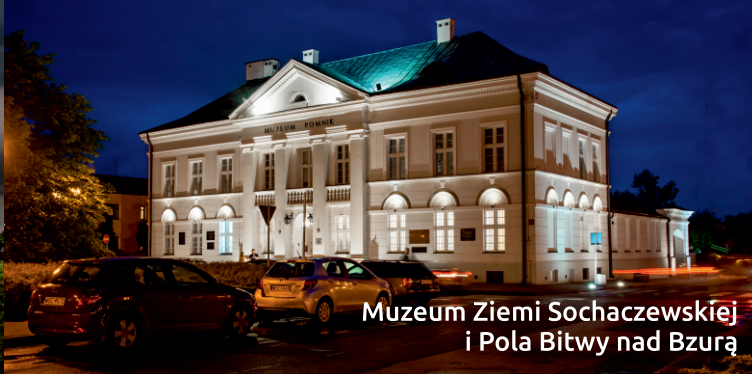
Muzeum Ziemi Sochaczewskiej i Pola Bitwy nad Bzurą