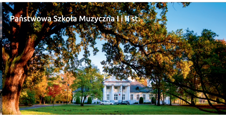
Państwowa Szkoła Muzyczna I i II st.