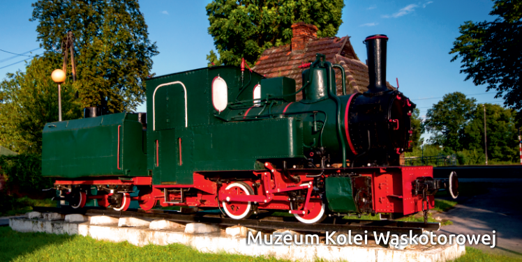
Muzeum Kolei Wąskotorowej