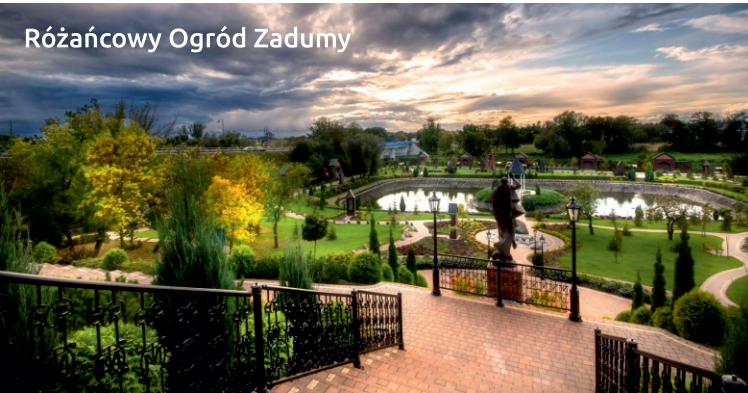
Różańcowy Ogród Zadumy

Na tyłach kościoła parafii św. Wawrzyńca znajduje się Różańcowy Ogród Zadumy. To wyjątkowe miejsce łączy ze sobą walory religijne, patriotyczne i historyczne. Spacerując chodnikami natrafimy na dwadzieścia tajemnic różańcowych. Całość okalają drogi stacji krzyżowej – na których tle widać sochaczewską historię. W ogrodzie nie brak jest też innych symboli, jak polski orzeł z zawieszonym na piersiach ryngrafem z Matką Boską Częstochowską. To nie tylko miejsce na modlitwę, ale również refleksyjny odpoczynek od zgiełku miasta. Ponadto w bocznej kaplicy, w misternie rzeźbionym złotym ołtarzu umieszczono zrekonstruowaną wierną kopię zaginionego, cudownego obrazu Matki Bożej Różańcowej – Sochaczewskiej. Liczne wota zawieszane na ścianach potwierdzają prawdziwość kultu tego wizerunku.