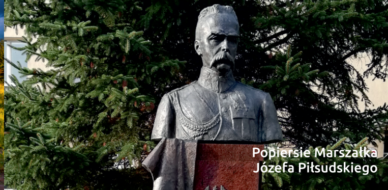
Popiersie Marszałka Józefa Piłsudskiego

Odwiedź Sochaczew, gród o niemal 700-letniej historii, usytuowany na skrzyżowaniu ważnych szlaków handlowych. Dzisiaj jest to niemal czterdziestotysięczne miasto o bogatej kulturze i dynamicznie rozwijającej się gospodarce, leżące zaledwie 1,5 kilometra od Żelazowej Woli. Sochaczew to miasto wielu wydarzeń kulturalnych, wśród których wyróżniają się Festiwal Jazzowy, Festiwal Folklorystyczny, Sochaczewskie Spotkania z Chopinem oraz Międzynarodowy Festiwal Chopinowski na Mazowszu. To również miasto licznych atrakcji historycznych. Swoją przygodę warto rozpocząć w Muzeum Ziemi Sochaczewskiej i Pola Bitwy nad Bzurą. Stamtąd udać się można na wzgórze zamkowe, gdzie w każde letnie popołudnie, wśród malowniczych ruin, odbywają się animacje dla zwiedzających. Z kolei z Muzeum Kolei Wąskotorowej wyruszyć można w niezapomnianą podróż Pociągami Retro do Puszczy Kampinoskiej. Sochaczew to idealne miejsce do uprawiania turystyki pieszej i rowerowej. Ciekawą ofertę stanowi plaża miejska z przystanią kajakową, skąd można wybrać się np. na spływ malowniczym dorzeczem Bzury. Dopiero dzięki wizycie w Sochaczewie można w pełni poznać walory Małej Ojczyzny Chopina.