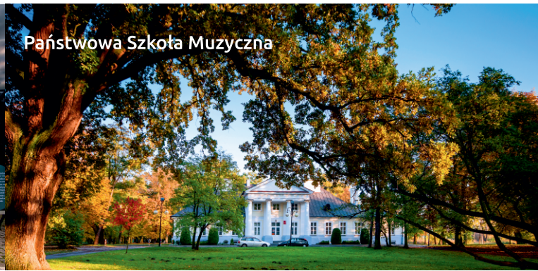
Państwowa Szkoła Muzyczna