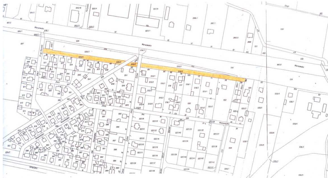
ul. Tadeusza Jasińskiego