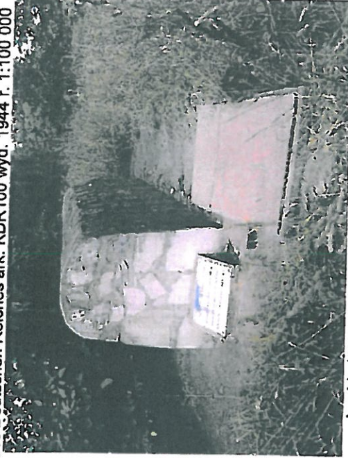
Lapidarium z wmurowanymi fragmentami maczew