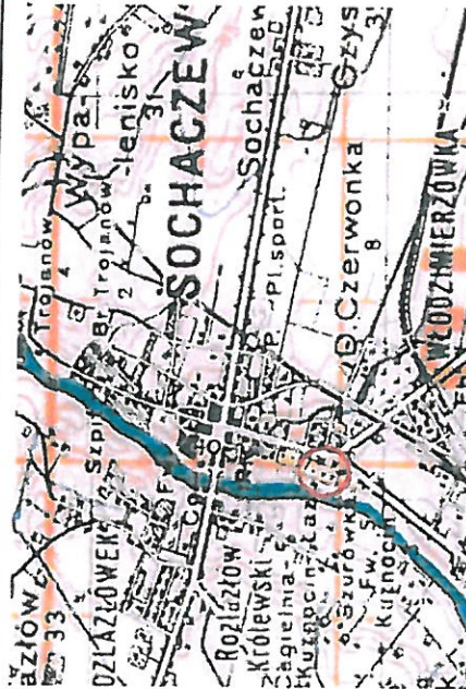
Karte des Deutschen Reiches ark. KDR100 wyd. 1944 r. 1:100 000