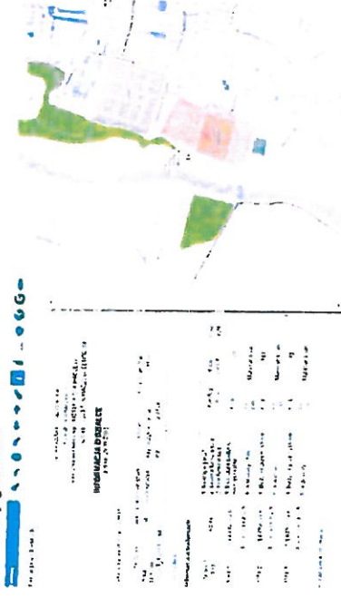
Współczesna mapa katastralna z lokalizacją cmentarza